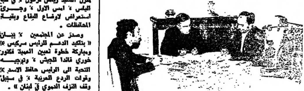
لجنة الصيالة خلال الاجتماع